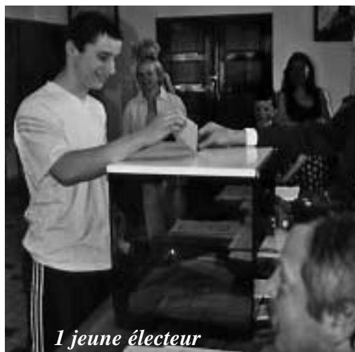
1 jeune électeur