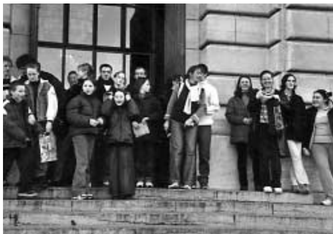
Visite au Palais des Beaux arts

Quelques chiffres sur l'animation jeunesse 2002 : 14 sorties avec 412 jeunes, 35 activités avec 260 jeunes, 4 ateliers avec 35 jeunes, 2 séjours au ski avec 99 jeunes., plus 120 jeunes ont fréquenté le point jeunes de Bachy.