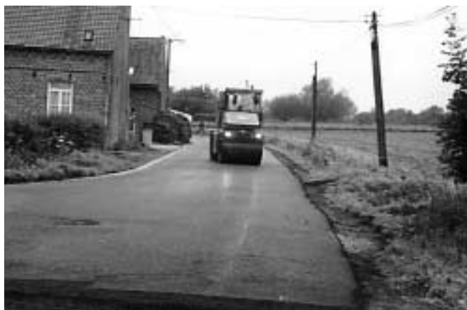
Entrée rue Clémenceau