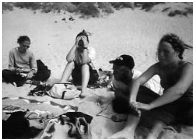
Août : camping