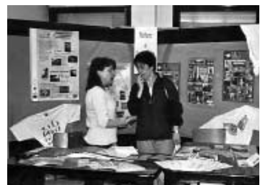
Nature et Patrimoine