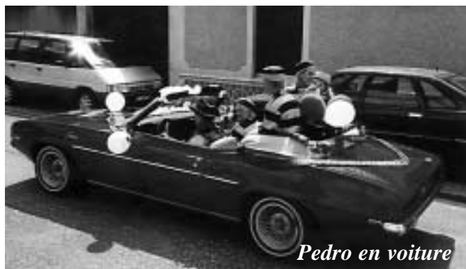
Pedro en voiture