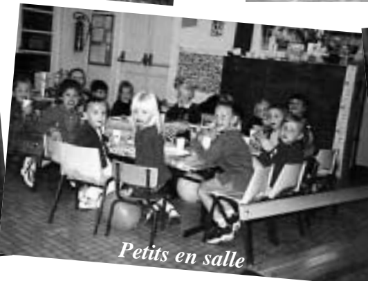
Petits en salle