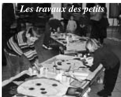
Les travaux des petits