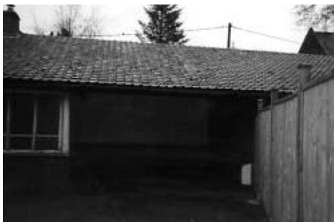
Le préau à l'école Dolto