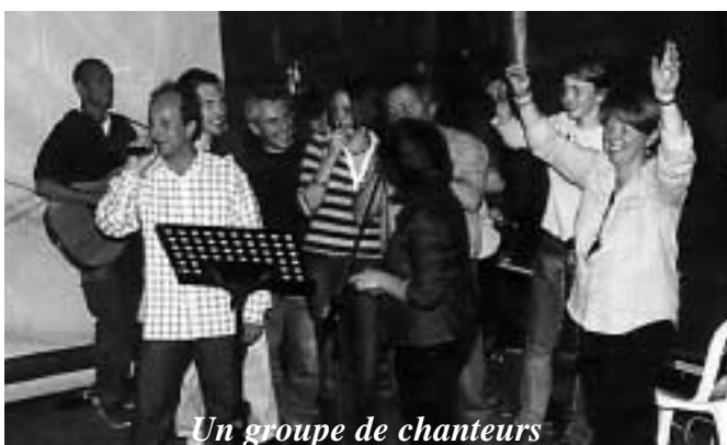
Un groupe de chanteurs