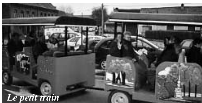
Le petit train