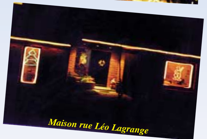
Maison rue Léo Lagrange