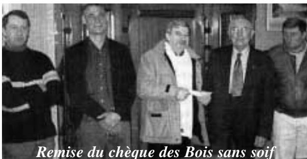
Remise du chèque des Bois sans soif