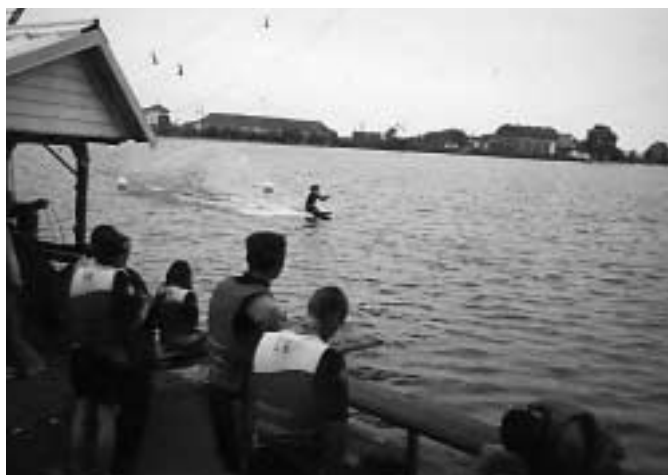
Sortie Ski nautique