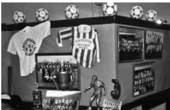
Entente Bachy Mouchin